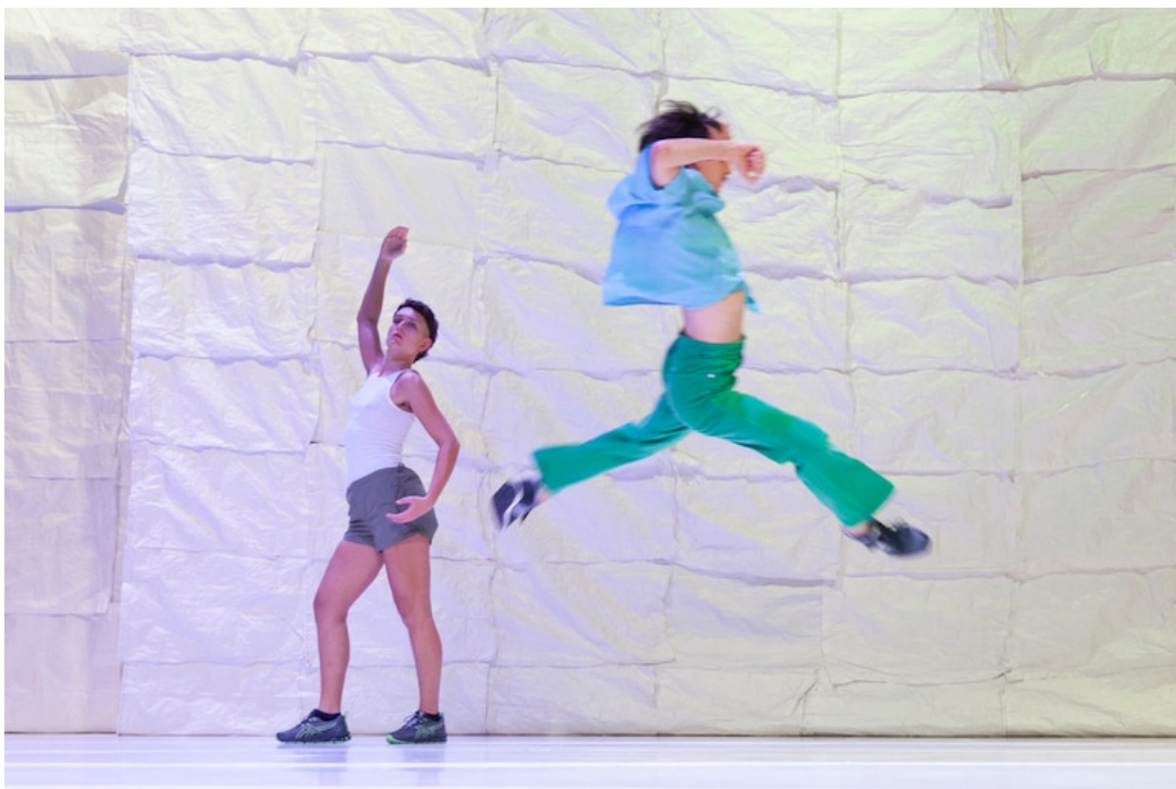
"Landfall" de Erika Zueneli est à découvrir les 7 et 8 juin aux Brigittines dans le cadre du festival TB 2 .